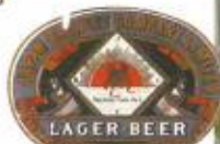
日本酿酒公司的啤酒标签

哥拉巴成立了名为“日本酿酒公司”的啤酒公司。据说蹲在哥拉巴故居温室旁的可爱的石狮子就是当年标签上的麒麟的原型，而该麒麟的胡子又是以哥拉巴的胡子为模特设计的…。