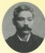
岩崎弥之助 Yanosuke Iwasaki

出身英国。1864年前后来日，在哥拉巴商会工作后，于1868年和英国人霍姆共同设立了“霍姆·林格商会”，并开设了为居留地的外国人和市民们提供交流场所的“内外俱乐部”。他从事的事业非常广泛，有长崎上水道建设、外国贸易、代理店、制茶、制粉、发电等。他于1898年在大浦海岸大道(旧香港上海银行长崎分行边)上修建的“长崎饭店”是名噪一时亚洲一流酒店。