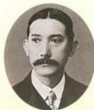
仓场富三郎 Tomisaburo Kuraba Thomas Albert Glover