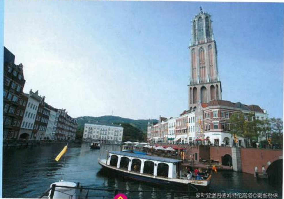
豪斯登堡内德姆特伦高塔

豪斯登堡是以中世纪欧洲为背景而建造的，再现了17世纪荷兰的街道风情，是一座适合旅居的大型综合度假城。经过特别批准，她成功再现了当今荷兰女王陛下居住的宫殿豪斯登堡，因此也被授予了这个高贵的名字——豪斯登堡。城堡内的剧场、商店、餐厅、酒店、公开出售的住宅等每一处建筑物都充满了个性，在绿色森林与古老运河的环绕中，交相辉映，使豪斯登堡成为名副其实的“森林之家”。总面积为152公顷的豪斯登堡，几乎与摩纳哥一般大小。这座世界最美的花园度假城，不论春夏秋冬，各色的时令花卉，都将街道装点得五颜六色，格外妖娆。