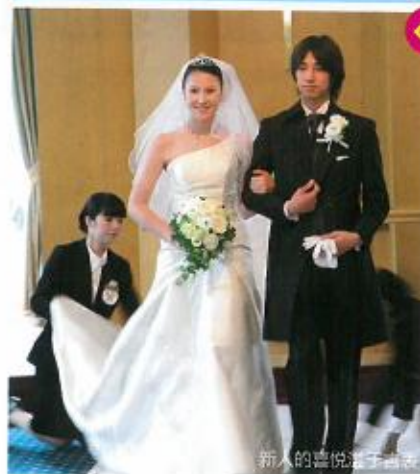
新人的喜悦