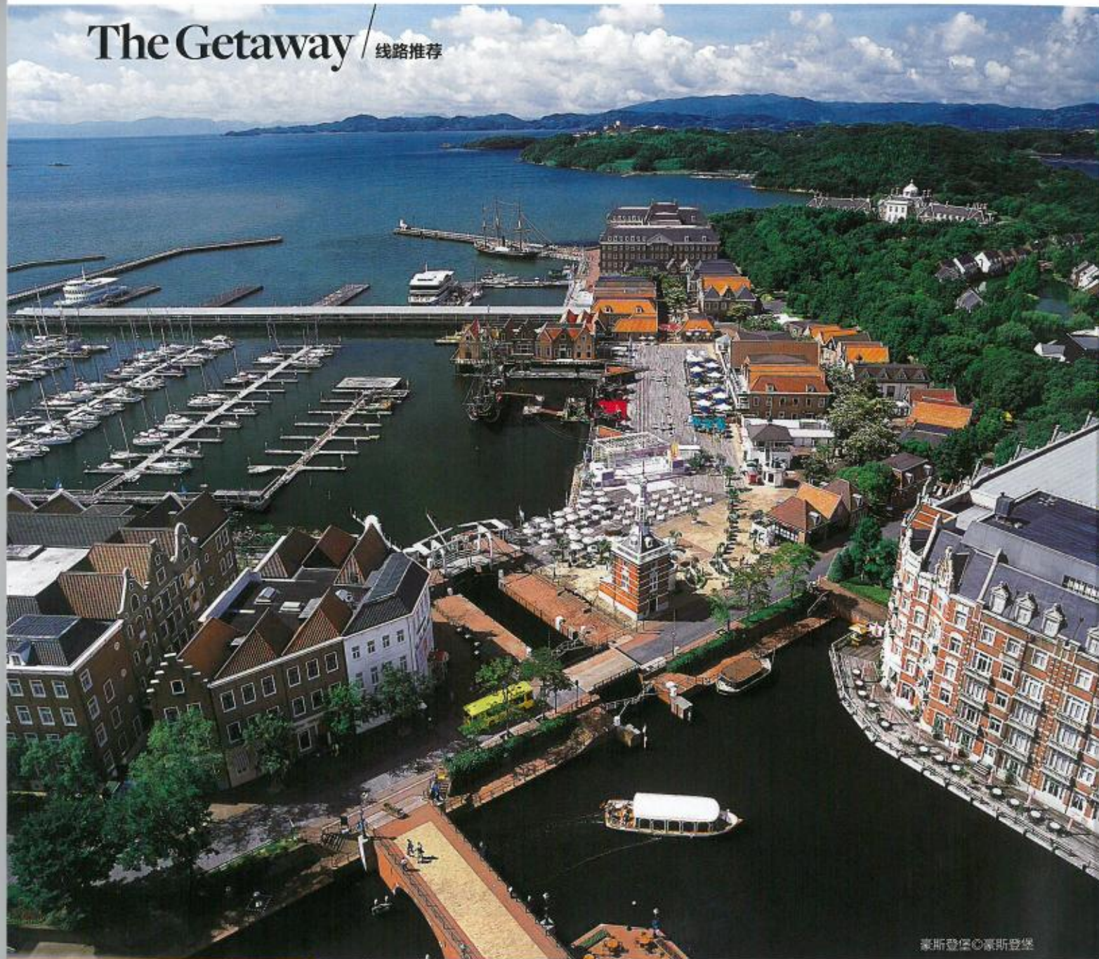
豪斯登堡