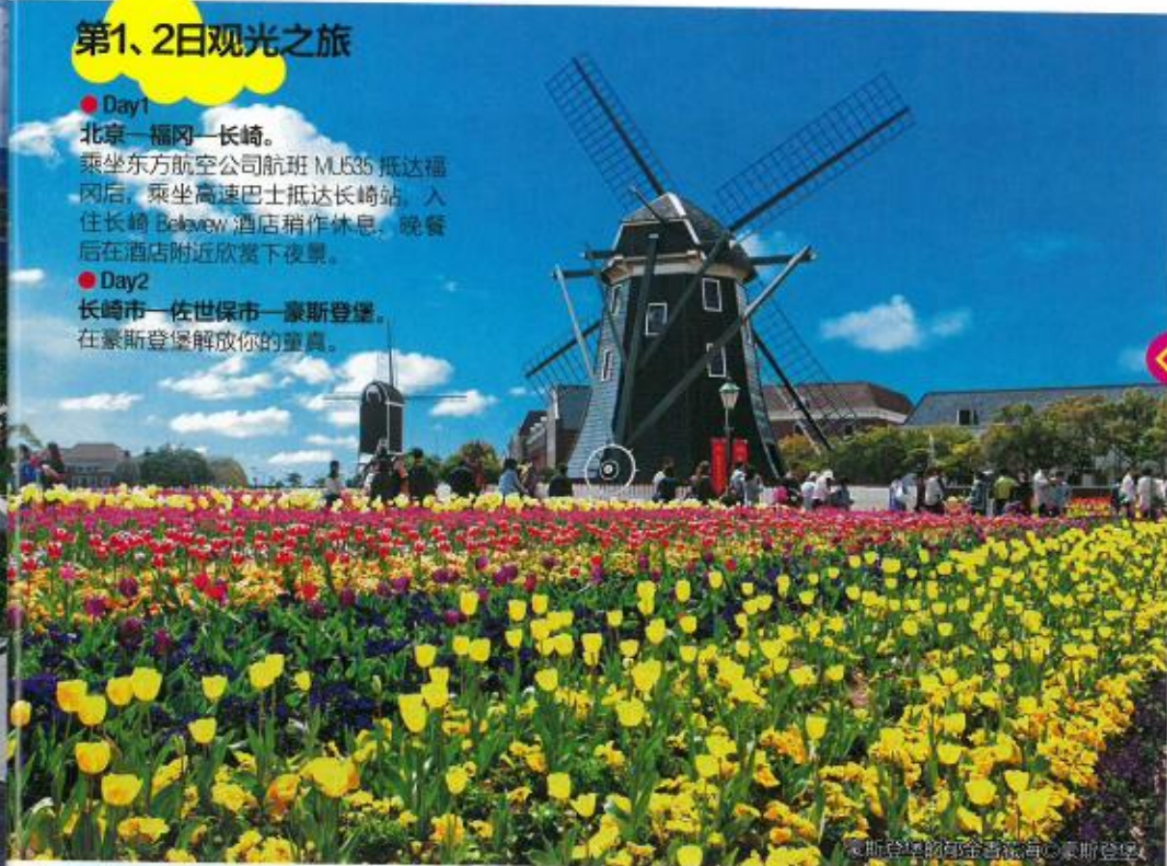
豪斯登堡的郁金香花海